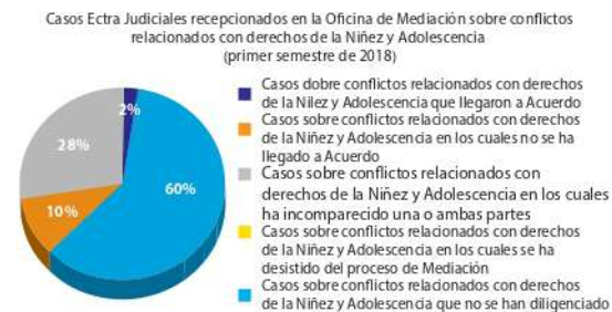
Gráfico 3 Casos Extra Judiciales de la Oficina de Mediación.

conforme a datos procedentes de la Oficina de Mediación de Encarnación.