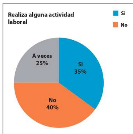
Gráfico N° 2. Actividad laboral

La mayoría de los jóvenes indicó que no trabaja, siendo que un porcentaje no menor ha dicho que sí, y otros respondieron que trabajan esporádicamente. Las razones laborales son determinantes para saber por qué lo llevan a cabo, o si es condicionante con las características de la generación. Cataldi y Dominighina (2015) sostienen que para esta generación las prioridades no son exclusivamente laborales; por otra parte, en el Paraguay existe una realidad acuciante de la falta de empleo para los jóvenes, según la (DGEEC) unos 260.000 jóvenes ni estudian ni trabajan y los mismos conforman el 13 % de la población juvenil. (ABC, 2019). Es importante señalar que, en la actualidad, las fuerzas