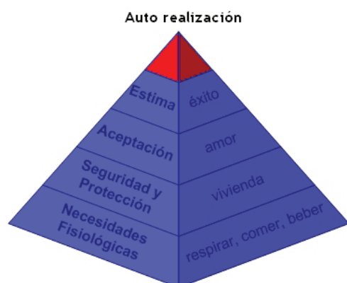
Fig 1. Pirámide de Maslow

Abraham Maslow en su artículo “Teoría sobre la motivación humana” propone que los seres humanos cuentan con una jerarquía de necesidades que se deben satisfacer en un orden específico.