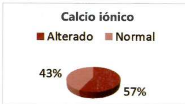
Gráfico 4. Valores de calcio iónico en los pacientes que concurren a alcohólicos anónimos.