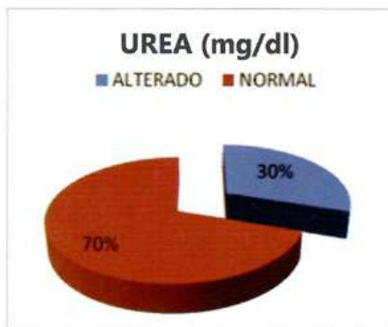
Gráfico 1: Valores de urea de los pacientes que asisten a "Alcohólicos Anónimos", de la ciudad de Encarnación.